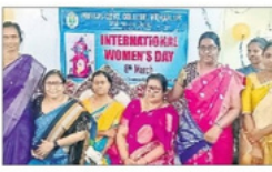
సభ్యుల అందరినూ మహిళా ఉపాధ్యాయులు