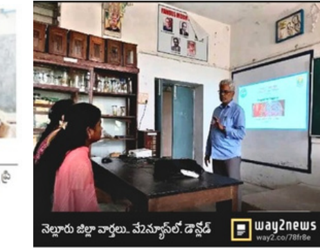
నెల్లూరు జిల్లా వార్డులు, మేన్యూస్ లో డాన్లడ్ way2news way2.co/78lr9e