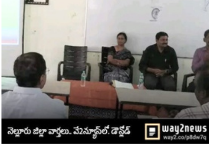
నెల్లూరు జిల్లా వార్డులు, మేన్యూస్ లో డాన్లడ్ way2news way2.co/p8dw7q